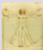
Leonardo da Vinci (†1519-2019)

Tutti gli INCONTRI si svolgeranno nei SABATI indicati dalle ore 18.00 alle ore 19.30 ca. presso la CASA DI EMMAUS in Fontanella di Sotto il Monte BG tel. 035.791227 e-mail: s.egidio@servitium.it www.priorato-santegidio.it