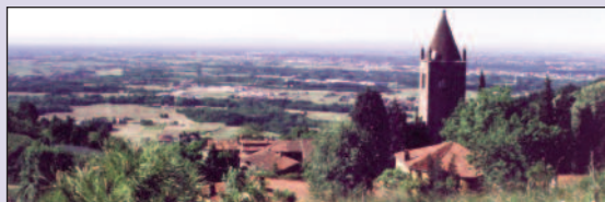
INCONTRI AL PRIORATO DI S. EGIDIO