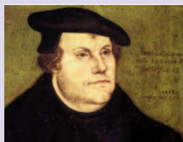
Martin Lutero 1483-1546

Tutti gli INCONTRI si svolgeranno nei SABATI indicati dalle ore 18.00 alle ore 19.30 ca. presso la CASA DI EMMAUS in Fontanella di Sotto il Monte BG tel. 035.791227 e-mail: s.egidio@servitium.it www.priorato-santegidio.it